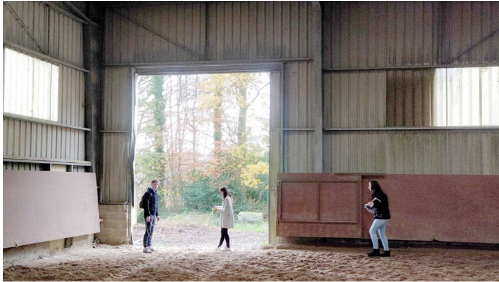
Relevé du manège