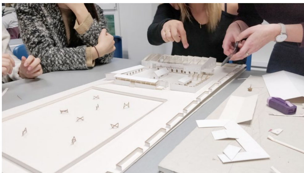
Mise en place de l'ensemble des bâtiments