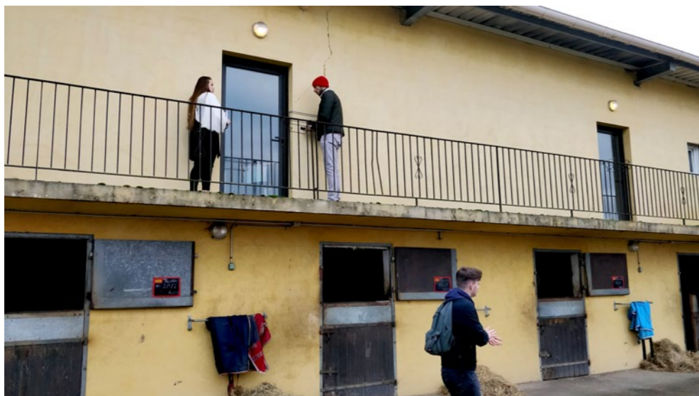
Relevé des bureaux et logements