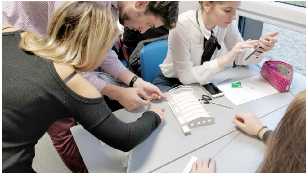
Charpente du manège