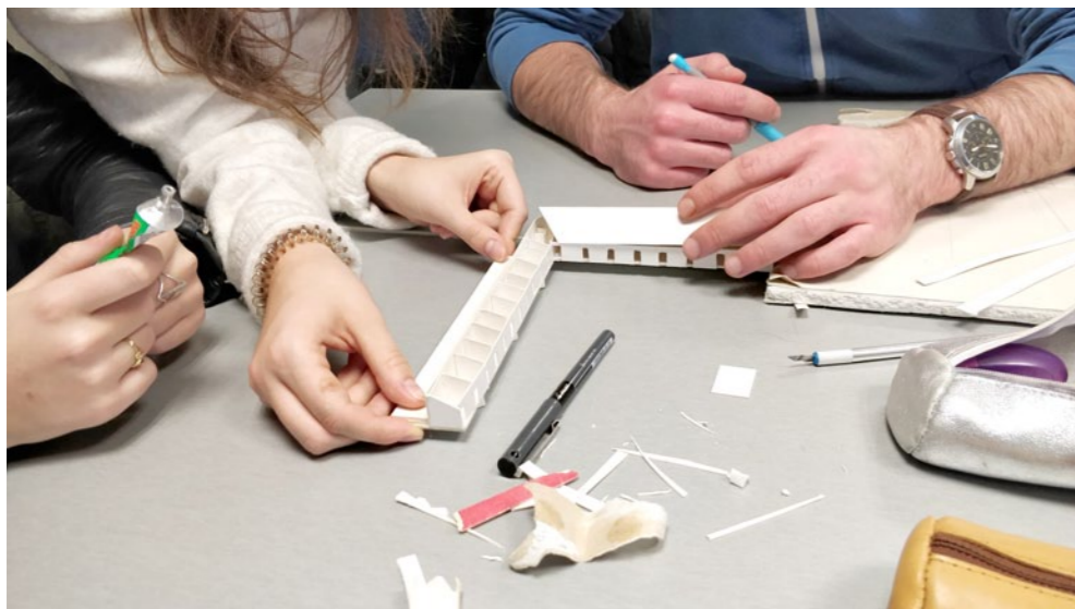
Les box en cours de fabrication