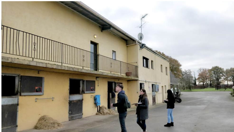
Relevé des bureaux et logements